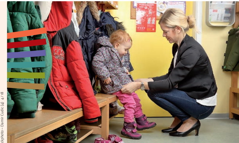
Gestaltung & Realisation: Hipconcept gmbh, Bonn | Bilder: fotolia.de – RioPatuca Images (6), extender_on (2), Ingo Bartussek (3), Stockphoto – Damir Cudric (4), 4/18

Die Qualifizierung „Elternbegleiter_in“ wird im Rahmen des Programms „Elternchance II – Familien früh für Bildung gewinnen“ durch das Bundesministerium für Familie, Senioren, Frauen und Jugend und den Europäischen Sozialfonds gefördert.